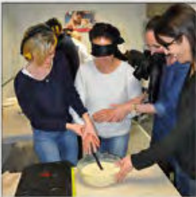
Sensibilisation CCAS EDF