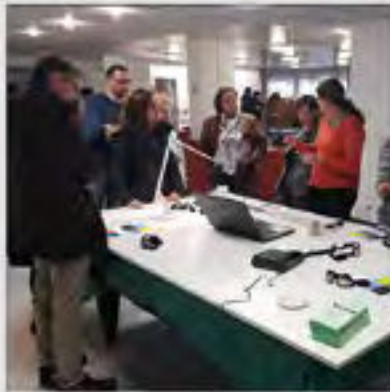
Sensibilisation Universite Lyon 1