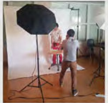
Roman Photo HTEKT